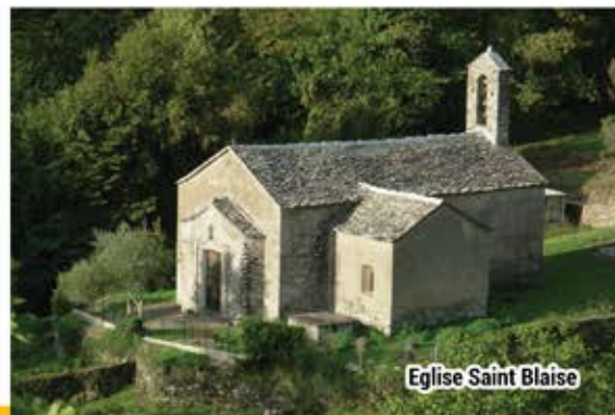
Eglise Saint Blaise

Ce sentier a été conçu et réalisé par la commune de Poghju Marinacciu.