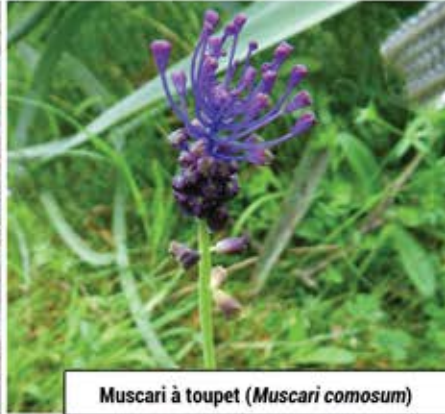
Muscari à toupet ( Muscari comosum )