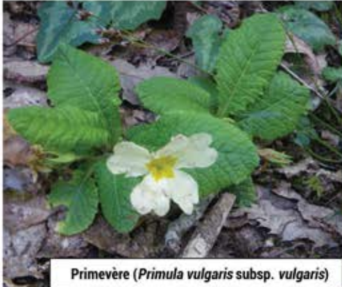
Primevère ( Primula vulgaris subsp. vulgaris )