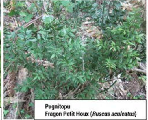
Pugnitopu Fragon Petit Houx ( Ruscus aculeatus )