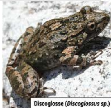
Discoglosse ( Discoglossus sp.)