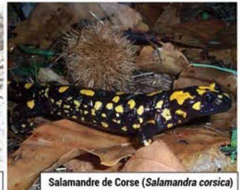
Salamandre de Corse ( Salamandra corsica )