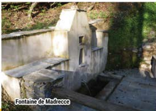
Fontaine de Madrece

Plusieurs éléments du patrimoine historique sont mis en évidence sur le sentier : l'église Saint Blaise, la fontaine de Madrece, un ancien moulin, la chapelle Sainte Elisabeth... Le hameau de Poghju abrite également plusieurs éléments remarquables comme un chêne tricentenaire ou un écomusée privé visitable sur demande.